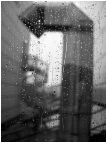
OLYMPUS DIGITAL CAMERA

Doc. 4 - « Machiner la pluie - totem urbain 1 » (Jean-Yves Fick, Gammalphabet, 13 juillet 2016, ici ).