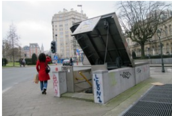
Doc. 3 - « La disparition de la jeune fille en rouge », image liminaire (François Bon, Tiers Livre, série « Étrangeté concernant les villes », ici ).

dresse la dénonciation de sa violence cachée, qui programme la disparition perlée des individus auxquels on cesse d'être attentifs, plus radicalement encore que ces objets vieillissants des boutiques étroites auxquels s'attache encore la nostalgie du promeneur [18]. L'instant de la saisie est d'autant plus dramatisé qu'il résonne comme celui d'autres pertes à venir. Le kairos de la rencontre du flâneur est un moment d'autant plus précieux qu'il est plus fragile, et le flâneur connaît le maelström menaçant dans lequel il se produit (« La rue assourdissante autour de moi hurlait », dit Baudelaire) : pour l'écrivain blogueur, ce n'est plus seulement le tourbillon de la ville, c'est aussi celui de l'espace virtuel du web qui lui confère la conscience aiguë de cette fragilité.